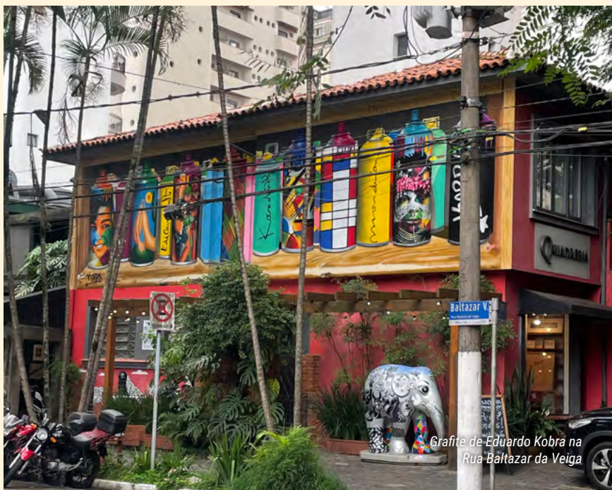
Grafite de Eduardo Kobra na Rua Baltazar da Veiga

A Casa, fundada por ela e agora cuidada por seus familiares, tornou-se um lugar inspirado na história da Arte