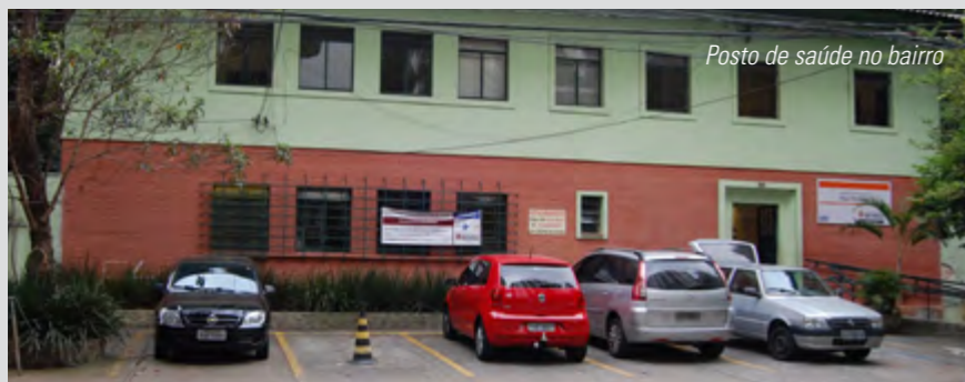
Posto de saúde no bairro

Unidade Básica de Saúde oferece aos moradores e trabalhadores da região atendimento médico em diversas especialidades