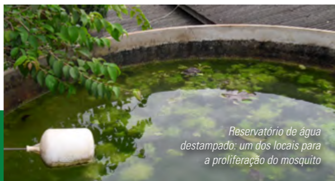
Reservatório de água destampado: um dos locais para a proliferação do mosquito

Proliferação do mosquito pode ser evitada com alguns cuidados